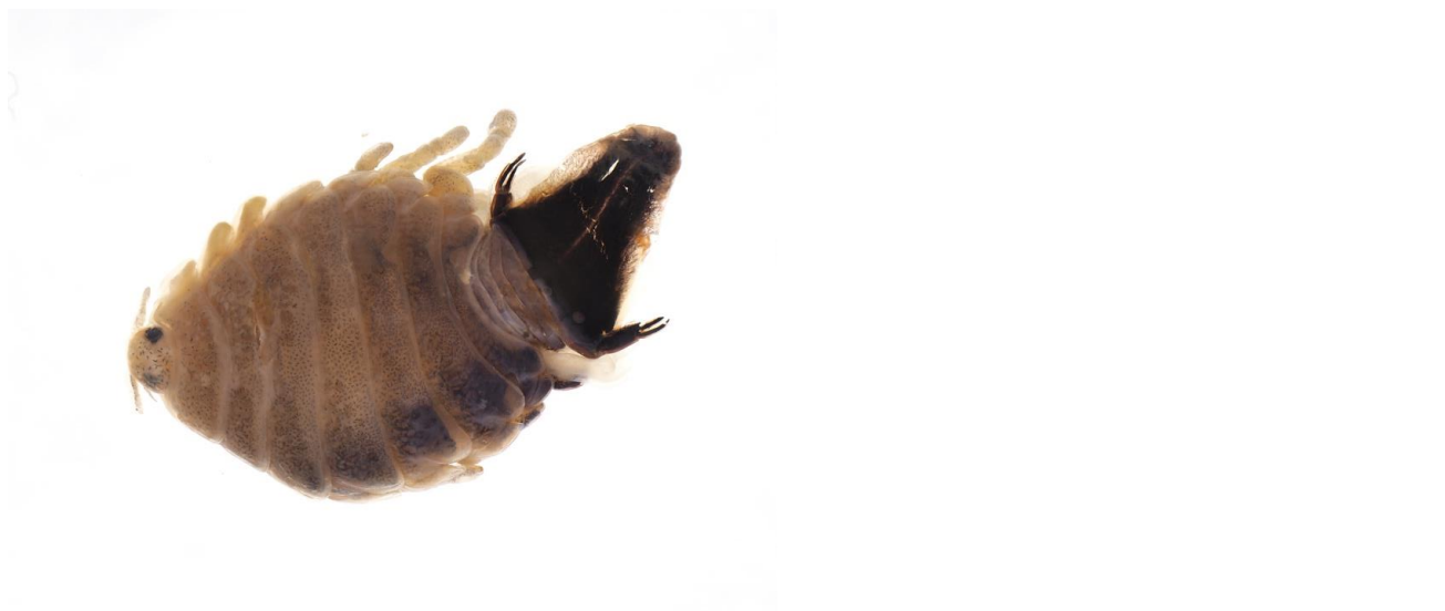
図 1. リュウノロクブungi Mothocya kaorui (注：左側が頭部、右側が腹尾節、全体が褐色なのは液浸保存による変色のため)