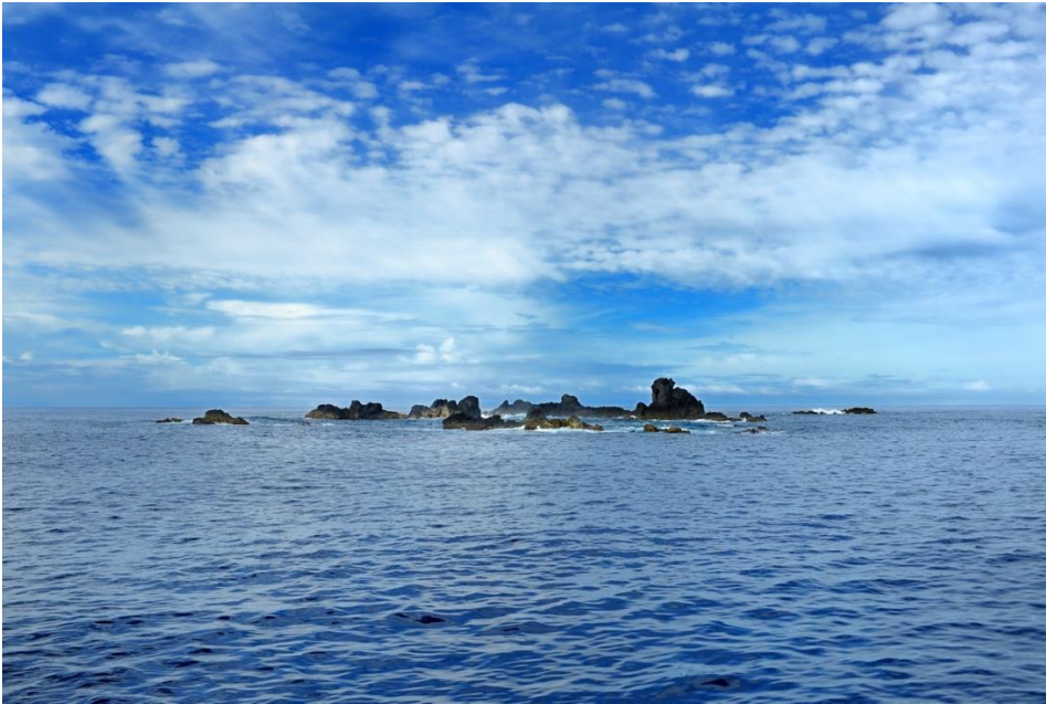
図3.ペヨネース列岩