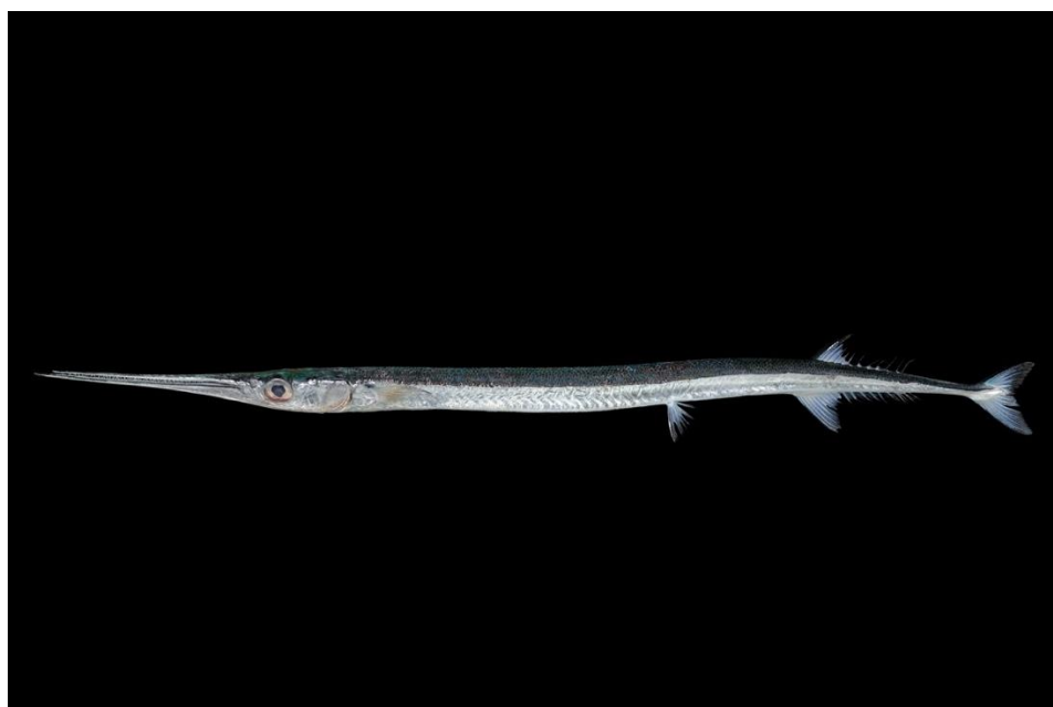
図 2. ベヨネース列岩産のヒメダツ