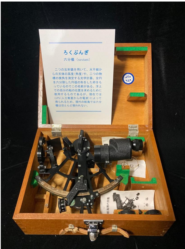
図4.現代の航海用六分儀（北海道大学総合博物館水産科学館所蔵）