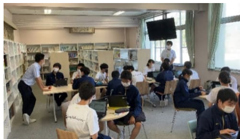
「総合的な学習の時間」でGoogleワークスペースを活用して、グループ内で情報を共有しながらまとめを作成。