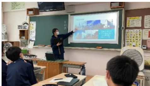
「数学科」でGoogleスライドを利用した発表の様子